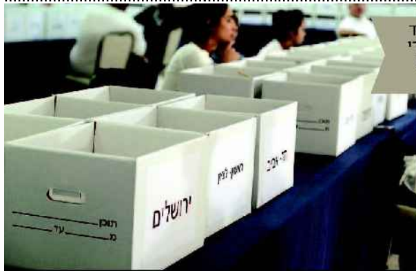
ריכוז הקלפיות בבחירות לרשויות המקומיות